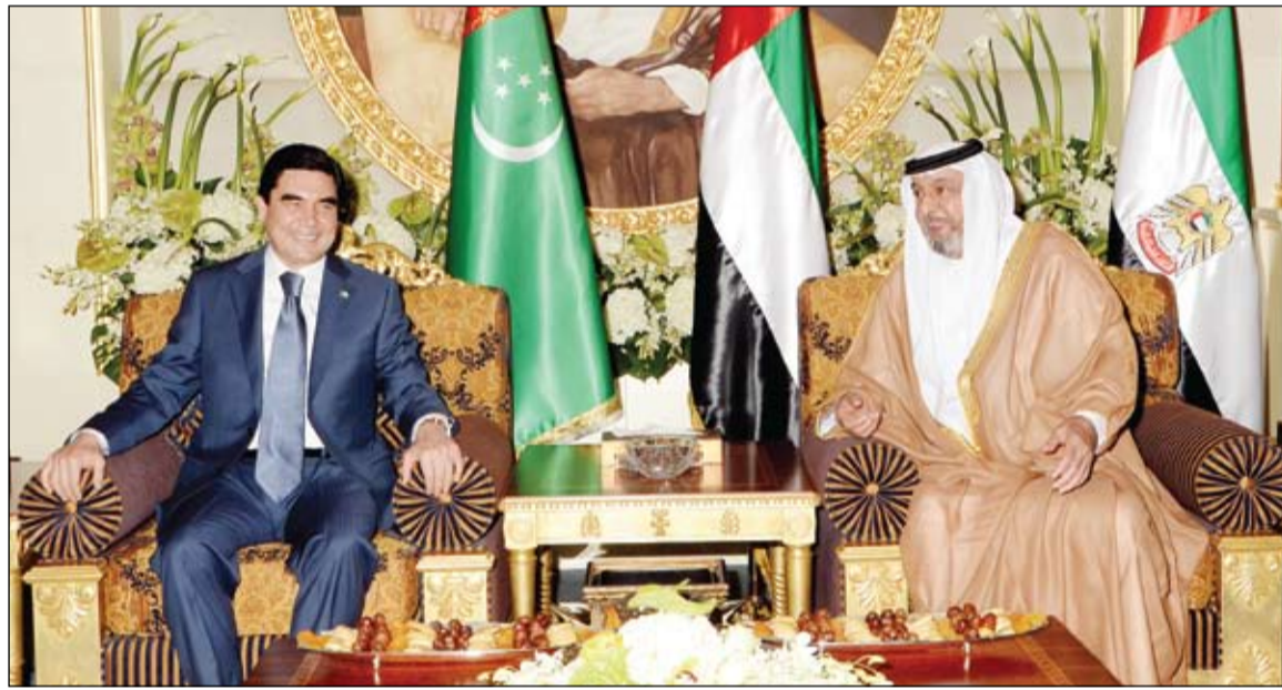
رئيس الدولة خلال مباحثاته مع رئيس تركمانستان

•• أبوظبي-وام: عقد صاحب السمو الشيخ خليفة بن زايد آل نهيان رئيس الدولة (حفظه الله) بعد ظهر امس في قصر الضيافة بالمشرف جلسة مباحثات مع فخامة قربان فولفي بيردي محمدوف رئيس تركمانستان الذي يزور البلاد حالياً بحضور الفريق أول سمو الشيخ محمد بن زايد آل نهيان ولي عهد أبوظبي نائب القائد الأعلى للقوات المسلحة. ورحب صاحب السمو رئيس الدولة بزيارة رئيس تركمانستان والوفد المرافق متمنياً سموه أن تسهم هذه الزيارة في المزيد من تعزيز علاقات الصداقة والتعاون القائم بين البلدين وأن تفتح آفاقاً أوسع للتعاون المشترك في مختلف المجالات. وأجرى صاحب السمو رئيس الدولة محادثات مع فخامة الرئيس التركمانستاني تركزت حول تطوير وتعزيز العلاقات المتميزة بين دولة الامارات وتركمانستان في إطار الرؤية المشتركة بين البلدين الصديقين لتكون علاقاتهما في تطور مستمر بما يخدم النمو في البلدين والتطور لتحقيق المصالح المشتركة. وتطرقت المباحثات بين الزعيمين الى تطور العلاقات بين دول مجلس التعاون لدول الخليج العربية ودول وسط اسيا بما تمثله هاتان المنطقتان من أهمية استراتيجية. كما تناولت المحادثات بحث عدد من القضايا الاقليمية والدولية الراهنة ذات الاهتمام المشترك. وأكد الجانبان أهمية التعاون الاقليمي والدولي لتعزيز الأمن والسلام في المنطقة.