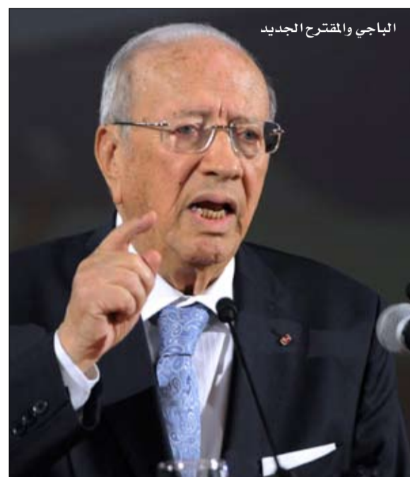
الباجي والمقترح الجديد