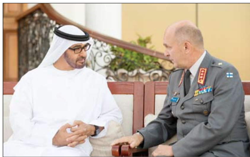
محمد بن زايد خلال استقباله نائب وزير الدفاع الفنلندي

•• أبوظبي-وام: أعلنت سفارة المملكة المتحدة لدى أبوظبي أن مواطني دولة الإمارات العربية المتحدة يمكنهم السفر إلى المملكة المتحدة بموجب وثيقة طلب الكترونية دون الحاجة إلى تأشيرة الدخول وذلك يتيح لهم زيارة المملكة بموجب الوثيقة الالكترونية فقط والبقاء فيها لمدة أقصاها ستة أشهر. وأشار بيان صحفي أصدرته السفارة امس أنه أصبح من اليسير إتمام الطلب الالكتروني للاستغناء عن التأشيرة وهو مجاني وأسرع من تقديم طلب التأشيرة العادية وليس هناك حاجة لتقديم بيانات أو الحضور لمركز تقديم التأشيرات أو تسليم جواز السفر للمركز قبل السفر حيث تصدر هذه الوثيقة فوراً عبر موقع إلكتروني آمن ويمكن الحصول عليها عبر الإنترنت من أي مكان في العالم للسفر بموجبها إلى المملكة المتحدة. (التفاصيل ص5)