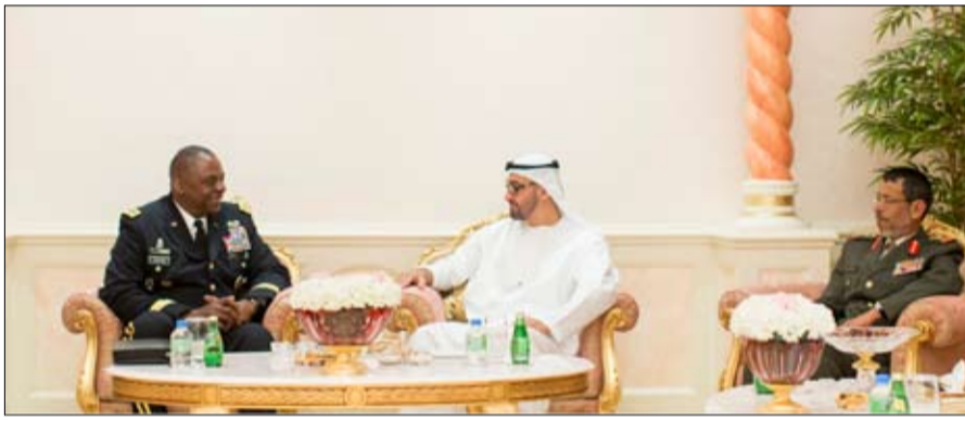
القسمي قائد القوات الجوية مبارك المزروعى وكيل ديوان أبوظبي وسعادة مايكل كوربين سفير الولايات المتحدة الأمريكية لدى الدولة.

وسبل تعزيزها وتطويرها بما يخدم المصالح المشتركة للبلدين الصديقين خاصة في مجالات التنسيق والتعاون الدفاعي. كما تناول اللقاء تبادل وجهات النظر حول المستجدات والأحداث الراهنة في المنطقة إضافة إلى عدد من القضايا ذات الاهتمام المشترك. حضر اللقاء سعادة الفريق الركن حمد محمد ثاني الرميثي رئيس أركان القوات المسلحة وسعادة اللواء الركن طيار محمد بن سويدان سعيد