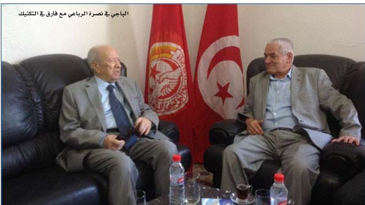
الباجي في نصرته الرباعي مع فارق في التكتيك

وأوضح المصدر أن التحقيق مع عدد من الإرهابيين المقبوض عليهم، كشف عن مخطط كان يستهدف السفارة الأمريكية، تم تحضيره من طرف قيادات إرهابية متواجدة في ليبيا، و تابع أنه تم إلقاء القبض على العناصر الإرهابية التي تم تكييفها بجمع المعلومات والمعطيات بخصوص تحركات قوات الأمن بجوار السفارة، و عدد الحراس على مستوى محيط المقر و أيضا الداخل والخارج، مبرزا أن عمليات البحث عن باقي العناصر متواصلة، رغم ورود معلومات تفيد بفرارها نحو الأراضي الليبية.