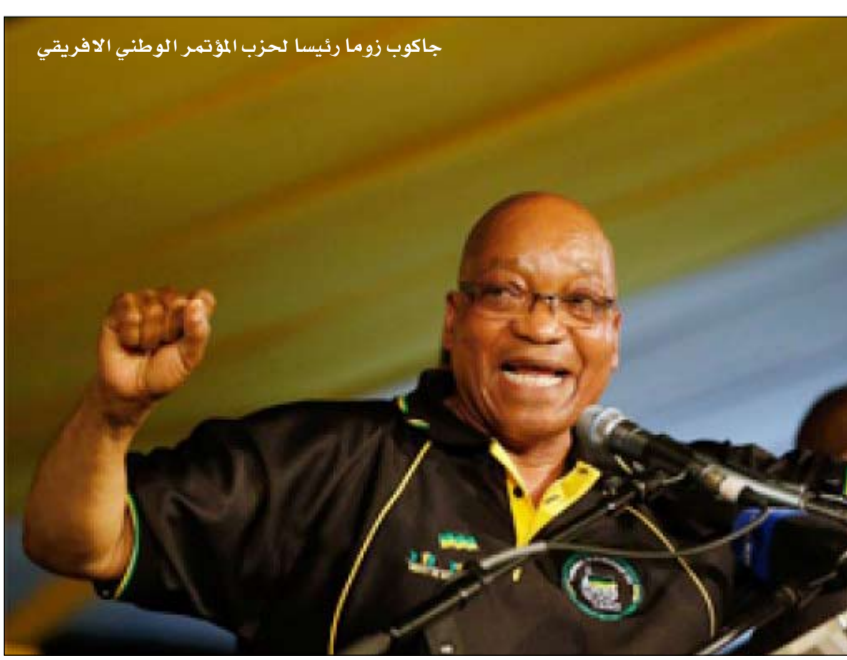
جاكوب زوما رئيسا لحزب المؤتمر الوطني الإفريقي

الحكومة التي تدمر اقتصادنا و مجتمعا. الثالث عشر من أكتوبر، كان الراديكالي والتشعوبي يوليوس مالمبا، الرئيس السابق لرابطة شباب حزب المؤتمر الوطني الإفريقي، والذي طرد من الحزب لعدم الانضباط في أبريل 2012، صاحب الضربة القاسية، فقد زعمه خلال انضمامه إلى المعارضة، مؤسسا حركته السياسية، التي أطلق عليها اسم مقاتلو الحرية الاقتصادية. وأعلن مالمبا خطط مجموعته قائلا إنها حركة احتجاجية،