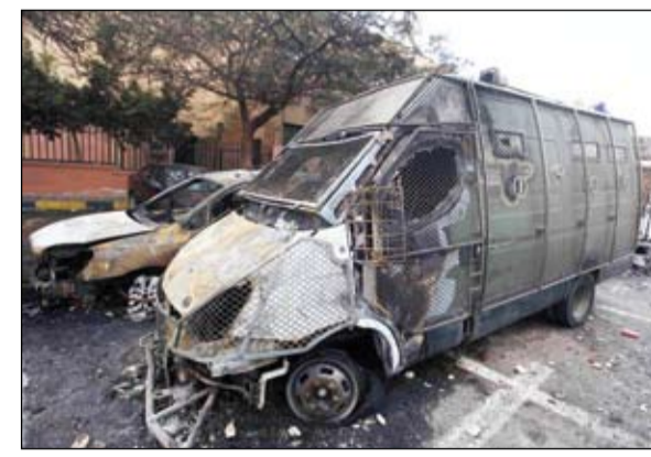
طلاب الاخوان يحرقون سيارات الشرطة امام جامعة الأزهر