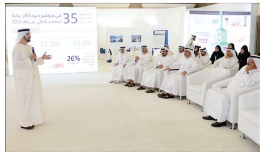
محمد بن راشد خلال كلمة له في نهاية الخوة الوزارية

•• أبوظبي-وام: استقبل الفريق أول سمو الشيخ محمد بن زايد آل نهيان ولي عهد أبوظبي نائب القائد الأعلى للقوات المسلحة امس في مجلس سموه في قصر